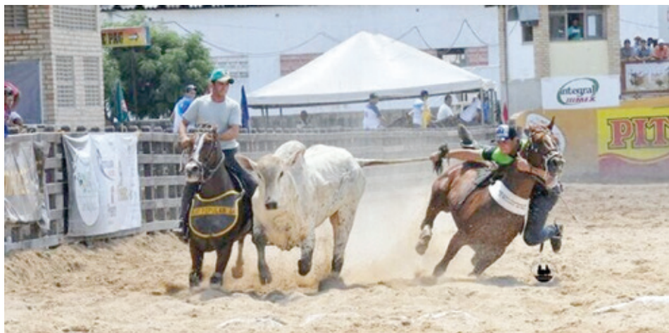
24ª Festa de Vaquejada será realizada entre os dias 13 e 15 de julho